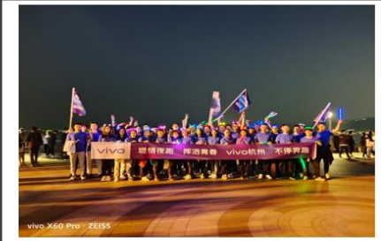
vivo X60 Pro+ ZEISS