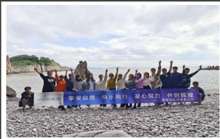
vivo X60 Pro+ ZEISS