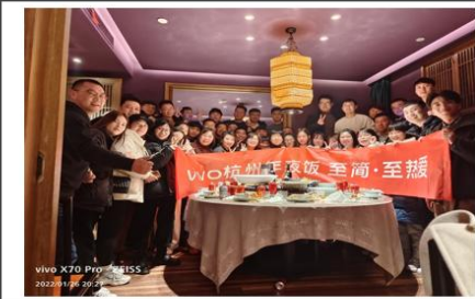
vivo X70 Pro+ ZEISS 2023-01-24 20:58