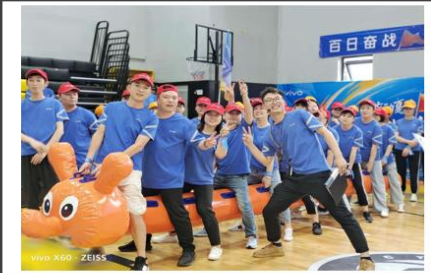
vivo X60 ZEISS