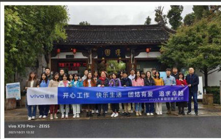
vivo X70 Pro+ ZEISS 2021-10-21 13:32